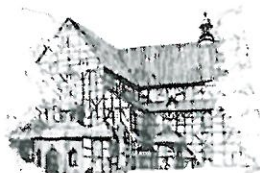
Kościół Pokoju pw. Sw. Trójcy Wpisany na listę UNESCO